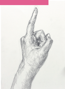
入学当初のデッサン