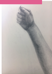
入学当初のデッサン